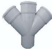
اتصالات فاضلابی چسبی - چهار راهی Intersection - adhesive wastewater fittings