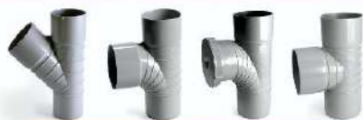
اتصالات فاضلابی چسبی - سه راهی تبدیل Adhesive wastewater fittings- Conversion y-branch