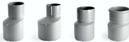
اتصالات فاضلابی چسبی - تبدیل Conversion - adhesive wastewater fittings