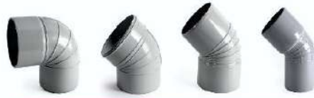
اتصالات فاضلابی چسبنا - زانو bent - adhesive wastewater fittings